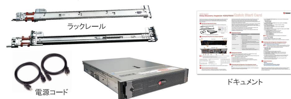
Deep Discovery Inspectorアプライアンス

Deep Discovery Inspectorの箱に次のものが同梱されていることを確認します。